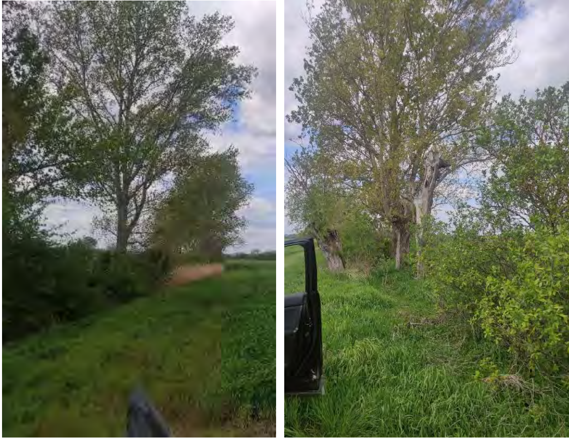
Abbildung 3: östlicher Rand GB; Blick Richtung Westen nördlich der „Sulze“ Abbildung 4: östlicher Rand GB; Blick Richtung Westen südlich der „Sulze“