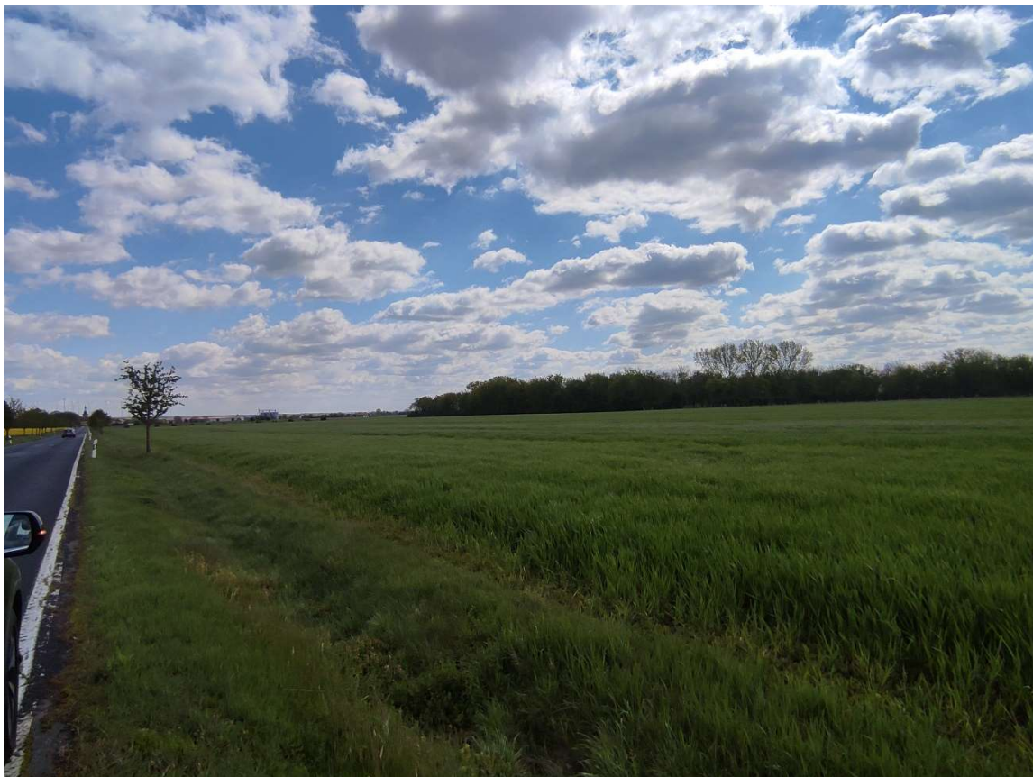
Abbildung 9: Kreisstraße K 507; Blick Richtung Kleinneuhäusen; rechts der westlichste Teil der Vorhabenfläche