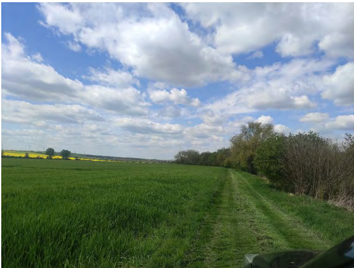
Abbildung 6: Blick Richtung Westen; rechts wasserführender Graben und „Lehmlöcher“; links westlichstes Ende der „Sulze“

Das Fließgewässer II. Ordnung Sulze unterquert am westlichen GB beginnend bis etwa mittig das PG und verläuft weiter Richtung Osten als „ Bach mit mittlerer Strukturdichte “ (2212). Die Sulze (vgl. Abb. 2-4) weist im UG einen auf beiden Bachseiten ausgebildeten Laubbaumbestand einheimischer Arten (Ufergehölzsaum) auf. Der Bachlauf ist zeit- und stellenweise noch wassergefüllt und wurde mit „ naturnahen Ufergehölzsäumen “ (22xx-712; §) kartiert. Das lineare Bachbett wird u.a. mit Gemeiner Esche sowie Schwarzerle und Bruch- und Silberweide bestimmt. Stellenweise dominieren aber auch Hybridpappeln. Untergeordnet kommen Feldahorn, Hänge-Birke, Hainbuche, Vogel-Kirsche, Linde und Schwarzer Holunder vor. Der Unterwuchs wird von nährstoffzeigenden Hochstauden (vor allem Großer Brennnessel, Kletten-Labkraut etc.) bestimmt. Obgleich der nährstoffreichen Verhältnisse zeigen die geringen Gewässerrandstreifen (vgl. Abb. 3) eindeutig anthropogene Beeinflussungen (intensive Bewirtschaftung der angrenzenden landwirtschaftlichen Flächen) auf. Die Sulze wird damit als geschütztes Biotop erfasst.