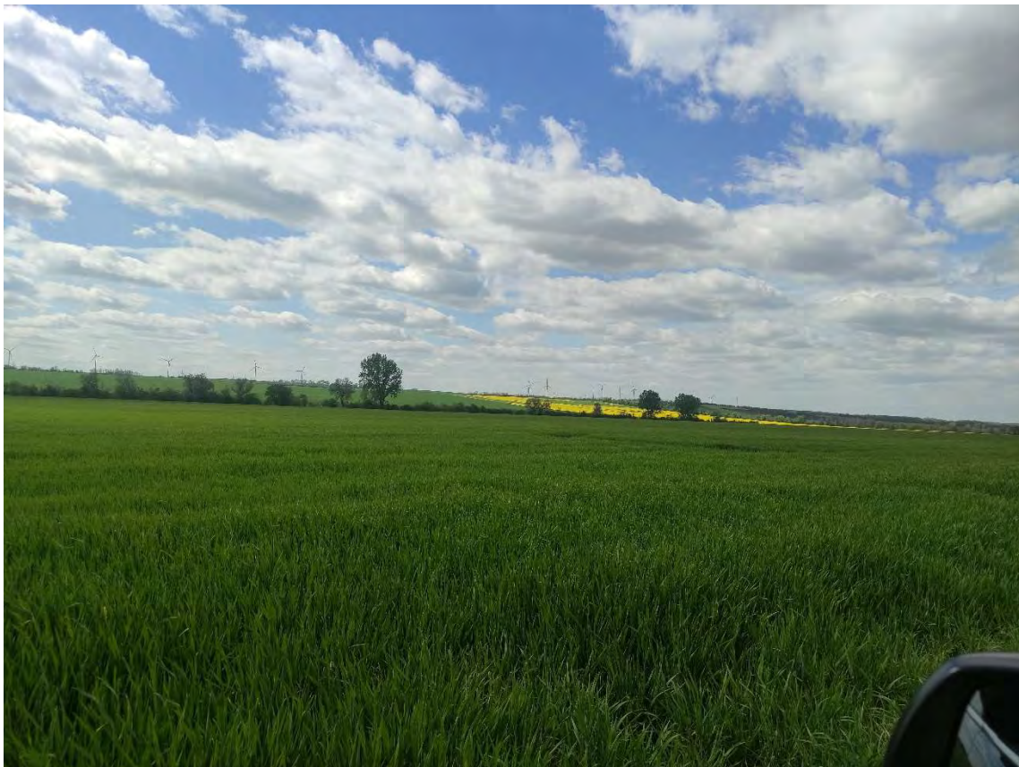
Abbildung 5: Blick Richtung Südwesten auf das westlichste Ende „Sulze“ im UG