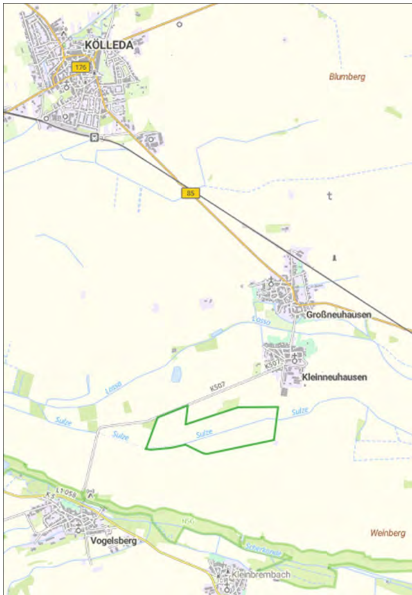
Abbildung 1: Flächenumgriff GB: grün; (Quelle: Thüringen Viewer, 05/2024; ohne Maßstab; bearbeitet jm | Landschaftsplanung)

Der Geltungsbereich (GB) des vB-Plan befindet sich im Landkreis Sömmerda, in der Verwaltungsgemeinschaft Kölleda, südlich außerhalb der Ortslage Kleinneuhäusen.