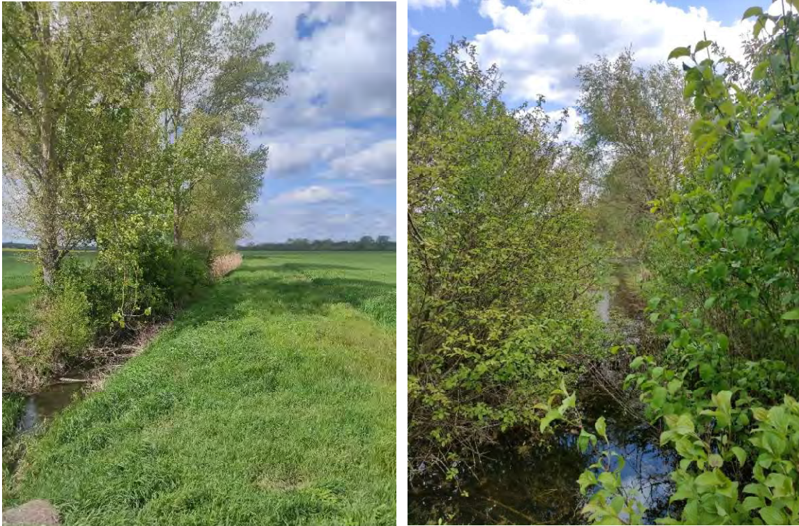
Abbildung 7: Blick vom Weg an „Lehmlöcher“ in östlichen wasserführender Graben; außerhalb Geltungsbereich