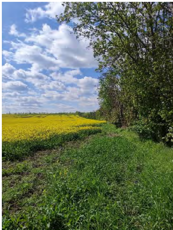
Abbildung 12: Grenze GB zu vB-Plan „Bürgersolarpark Vogelsberg“; Blick von K 507 in Richtung Süden

Intensives „ Ackerland, Ackerwirtschaft “ ist der vorherrschende Biotop- und Nutzungstyp (4110) im PG, auf dem vorrangig Getreide, Raps usw. angebaut werden. Durch effizienten Einsatz von Dünger und landwirtschaftlichen technischen Geräten wird ein erfolgreicher Anbau gesichert werden. Eine sekundäre Flora ist demzufolge nur spärlich vorhanden und weitgehend auf die Ackerränder beschränkt.