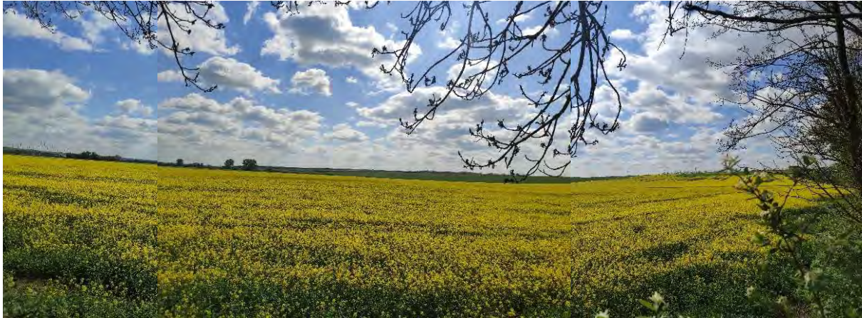
Abbildung 11: Biotop „Ackerland“ (4110); Blick von Kreisstraße K 507 auf westliche Vorhabenfläche Kleinneuhausen

Intensives „ Ackerland, Ackerwirtschaft “ ist der vorherrschende Biotop- und Nutzungstyp (4110) im PG, auf dem vorrangig Getreide, Raps usw. angebaut werden. Durch effizienten Einsatz von Dünger und landwirtschaftlichen technischen Geräten wird ein erfolgreicher Anbau gesichert werden. Eine sekundäre Flora ist demzufolge nur spärlich vorhanden und weitgehend auf die Ackerränder beschränkt.