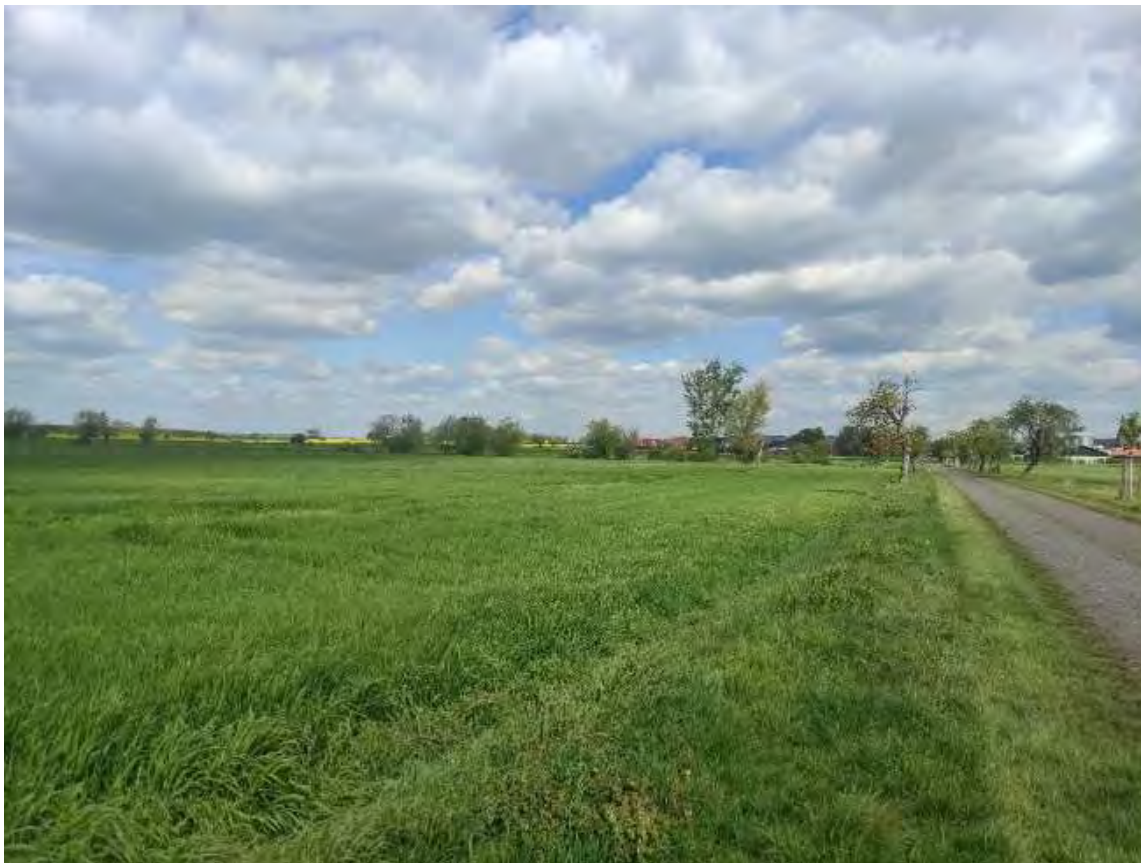
Abbildung 10: Blick Richtung Norden auf den östlichsten Teil der Vorhabenfläche zum wasserführenden Graben; rechts die Gemeindestraße nach Kleinbrembach

Weiterhin sind unversiegelte Wirtschaftswege (Biotop- und Nutzungstyp 9214) mit untergeordneter Verkehrsbedeutung im PG vorzufinden. Die Feldwege mit landschaftsgerechten Spurbahnen dienen ausschließlich der Bewirtschaftung landwirtschaftlicher Grundstücke. Beide Feldwege sind bis an die Ränder bewirtschaftet, so dass Rückzugsräume bzw. Nahrungsangebote für Arten des Offenlandes fehlen; abgängige Funktion für den lokalen Biotopverbund.