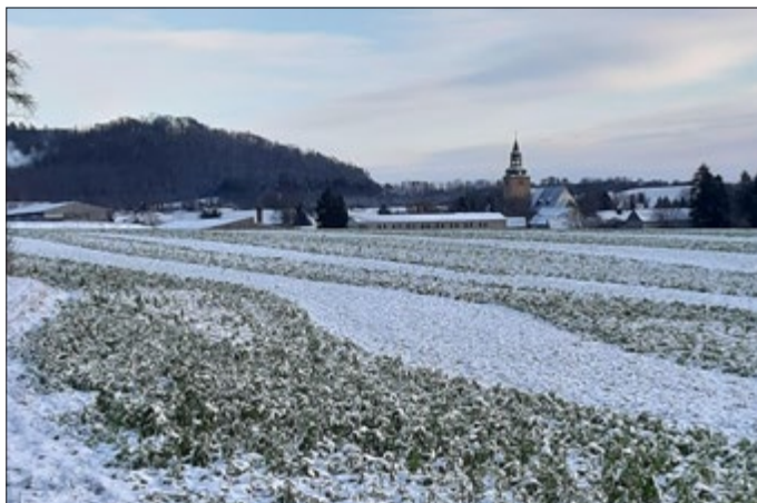
Blick auf Großmonra