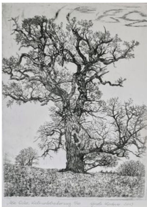
Zum Beispiel „Alte Eiche“ Kaltnadelradierung 2013 Größe 30cm x 39cm, diese Radierung hat sie den Palliativ Hospiz Weimar gespendet. Ihre letzten Tage verbrachte sie im Hospiz in Weimar.

Es sind in dieser Zeit relativ viele Arbeiten entstanden. Radierungen war Ihr Spezialgebiet. Die Liebe zur Natur bis ins kleinste Detail sieht man Ihren Werken an.