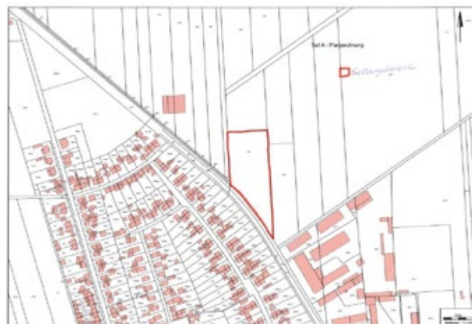
Auszug aus archikart-Lizenz der Stadt Kölleda - unmaßstäblich