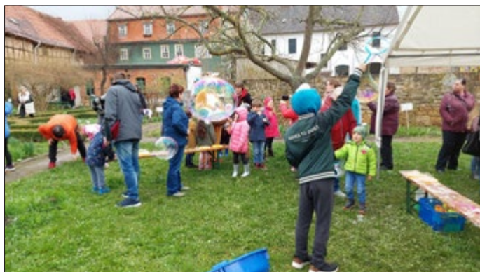
Der Osterhase versteckt hinter einer Riesenseifenblase