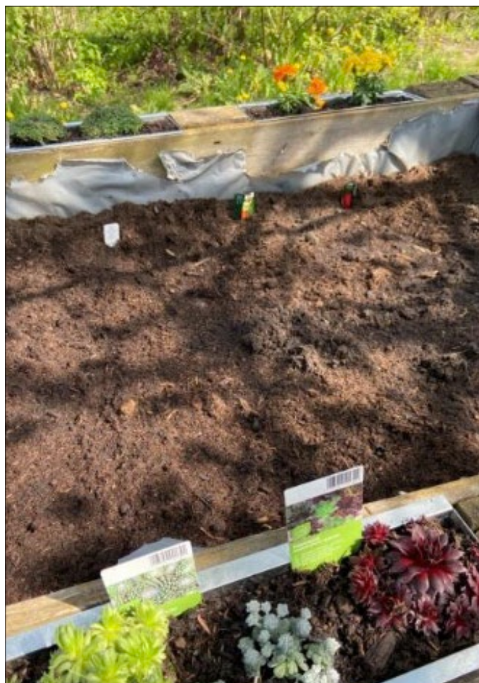
Die Beete des Bibelgartens blühen wieder.

Förderverein Evangelische Schule Sömmerda e. V.