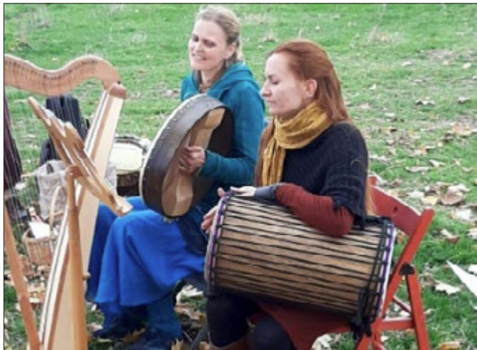
Das Windberg-Duo „Solunor“ singt eigene Erden- und Seelenlieder und auch die drei Schulbands der „Freien Gemeinschaftsschule am Windberg“ werden ihr musikalisches Talent präsentieren.