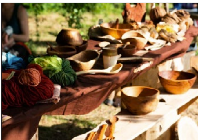
Neben handgefertigtem Schmuck und Accessoires vom „Atelier ichbin“ gibt es auch selbst gesponnene und natürlich gefärbte Wolle sowie handgeschnitztes Holzgeschirr zu kaufen.