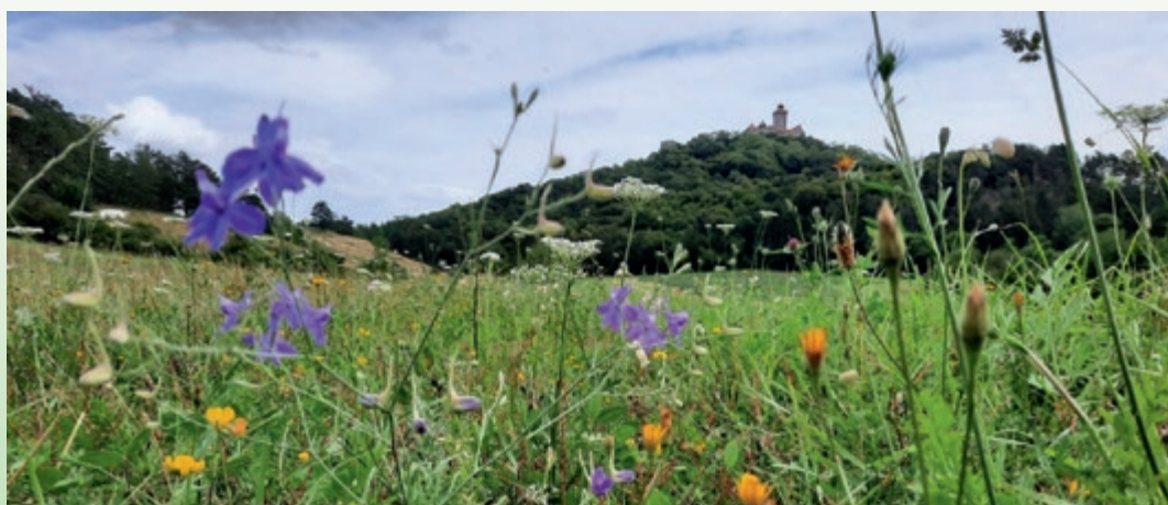
VIA Natura Feldrain bei der Wachsenburg, Thüringen