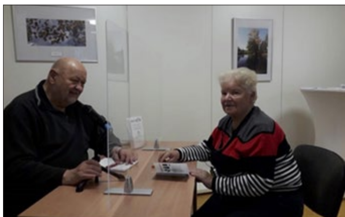
Beratungsgespräch 2022, Haus des Miteinander Hörens Weimar, DSB OV Weimar e. V.

Telefon: 0 36 43 /42 21 55 Mittwoch: 10:00 - 12:00 Uhr und 14:00 - 17:00 Uhr Fax: 0 36 43 /42 21 57 E-Mail: sozialerdienst@ov-weimar.de Internet: www.ov-weimar.de