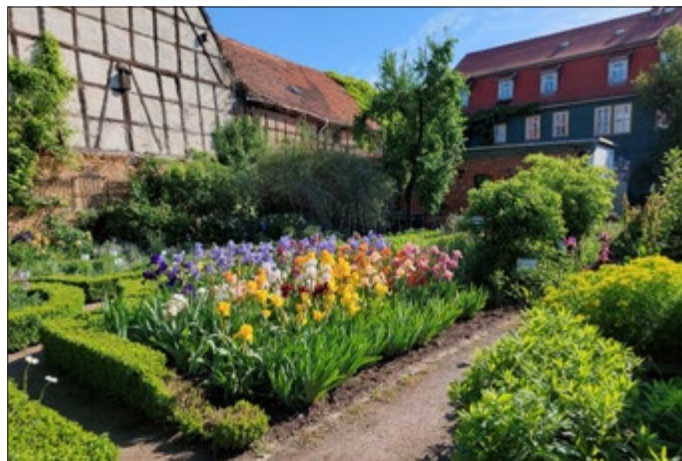
Schwertlilien in den herrlichsten Farben

Heute schon möchte der Kultur- und Museumsverein zum 28. Museumsfest am 2. und 3. September 2022 einladen. Der Thematische Abend am Freitag wird zu den Ausgrabungen im Gewerbegebiet bei Kölleda informieren. Am Sonnabend findet die Museumsmeile mit mehreren Angeboten statt. Bis dahin wünschen wir eine schöne Sommerzeit und hoffentlich ein gesundes Wiedersehen.