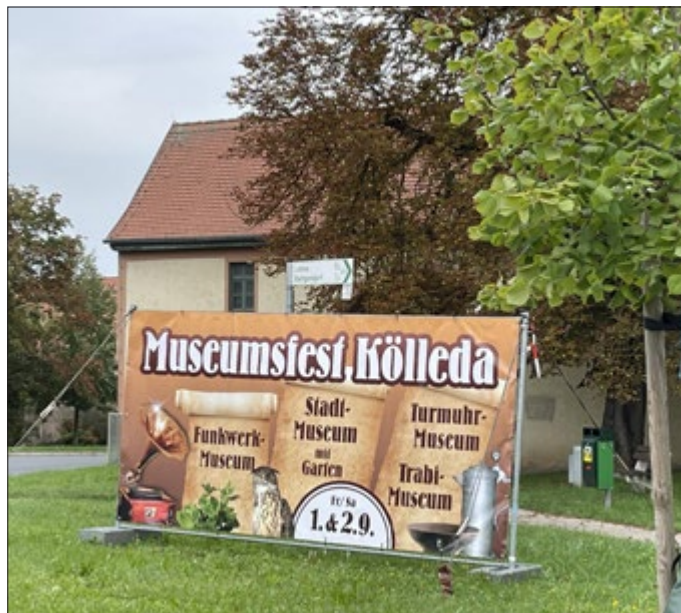
Banner am Ortseingang