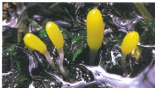
Sumpfhäubchenpilz, Pilz des Jahres 2023