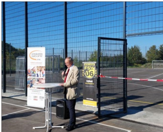
Eröffnung durch Bürgermeister Lutz Riedel