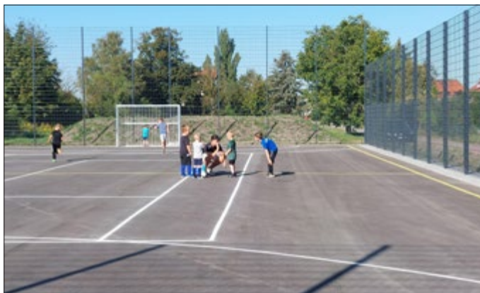
Bambinis vom FSV 06