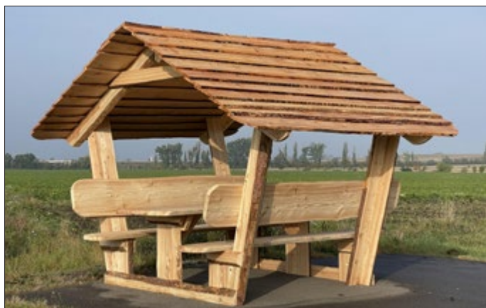
Waldschänken in Dermsdorf