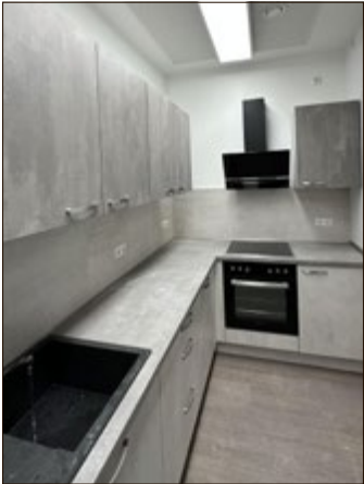
Die neue Küche des DGH Beichlingen