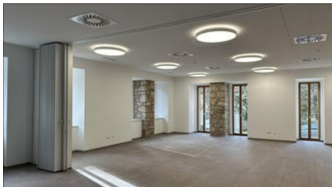
Ein großer, lichtdurchfluteter Raum ist entstanden

Die Einweihung ist nicht nur ein Anlass zum Feiern, sondern auch eine Gelegenheit, um allen Beteiligten zu danken.