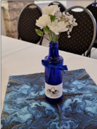
Mit Liebe zum Detail wurden zur Eröffnungsfeier die Tische dekoriert

Das Projekt, das die Dorfgemeinschaft stärken soll, wurde mit einem Kostenaufwand von ca. 1,7 Millionen Euro realisiert. Die Bauarbeiten erstreckten sich über mehr als 1,5 Jahre, in denen das Gebäude Schritt für Schritt Gestalt annahm. Durchgeführt wurden die Bauarbeiten vorwiegend von Firmen aus der Region.