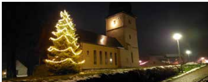
St. Katharinenkirche zu Battendorf