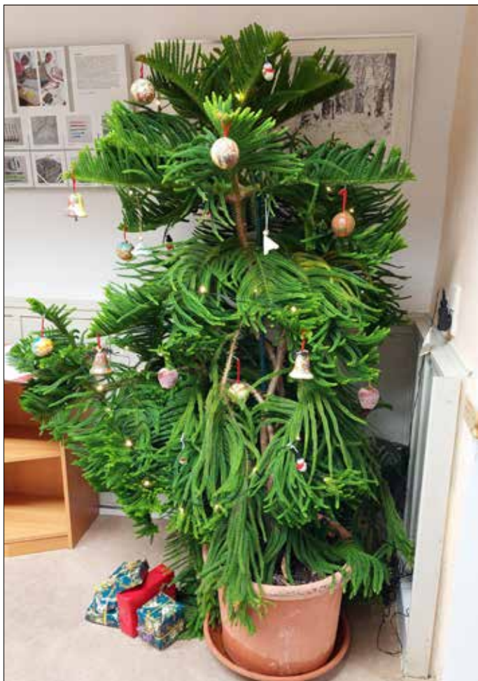
Eine weihnachtlich geschmückte Zimmertanne