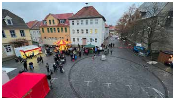
Antje Lippich Öffentlichkeitsarbeit